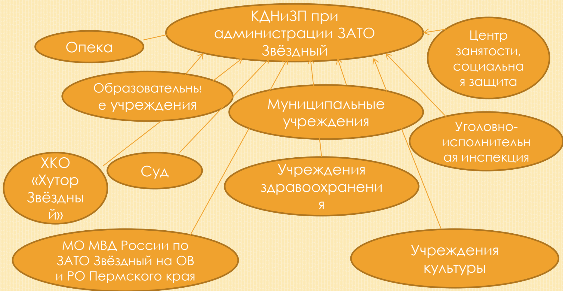
СХЕМА МОДЕЛИ ВЗАИМОДЕЙСТВИЯ УЧРЕЖДЕНИЙ СИСТЕМЫ ПРОФИЛАКТИКИ ПО РАБОТЕ С БЕЗНАДЗОРНОСТЬЮ И ПРАВОНАРУШЕНИЯМИ