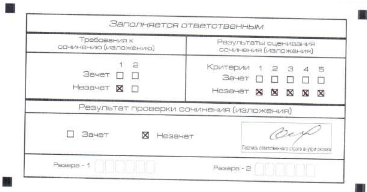
Рис. 5. Область для оценки работы

Эксперт комиссии (ответственное лицо) выставляет «незачет» за невыполнение требования № 2. В клетки по всем пяти критериям оценивания выставляется «незачет». В поле «Результат проверки сочинения (изложения) ставится «незачет».