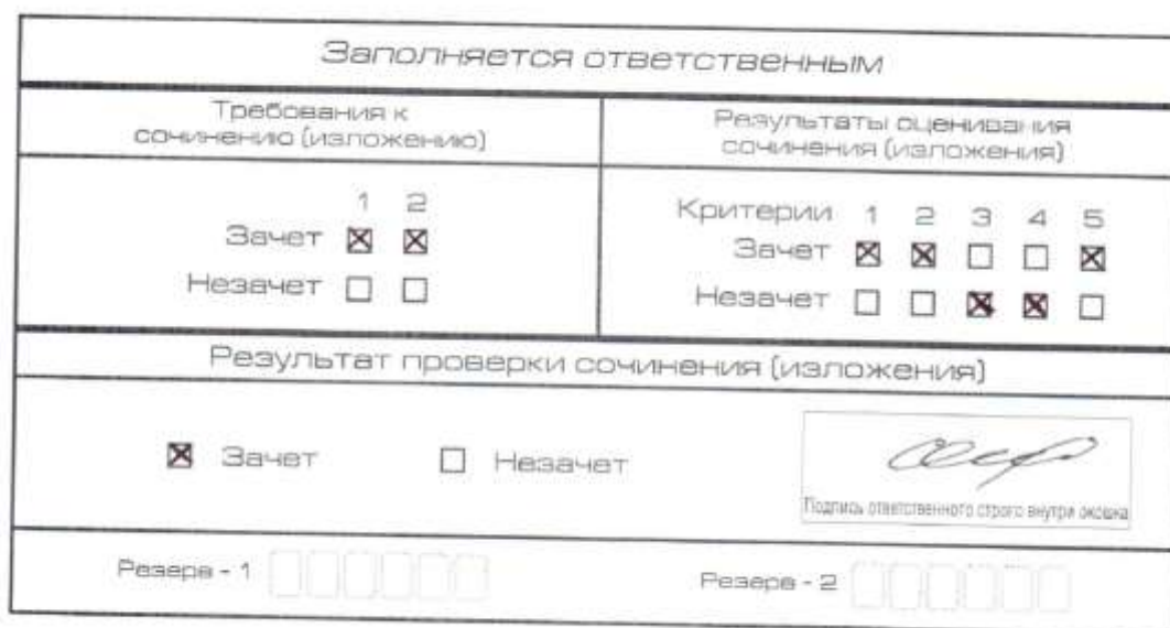
Рис. 6. Область для оценки работы

После окончания заполнения бланка регистрации ответственное лицо ставит свою подпись в специально отведенном для этого поле.